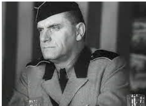
Fritz Julius Kuhn

Niektorí národní socialisti, americkí aj iní, sa ešte aj dnes pri vyslovení jeho mena hanbia. Považujú Bund za veľmi